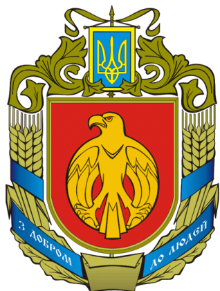
Герб Кіровоградської області