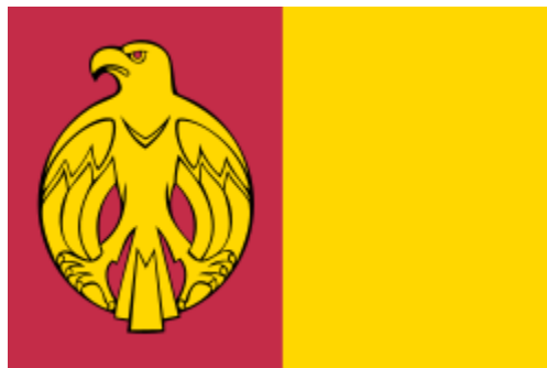
Прапор Кіровоградської області